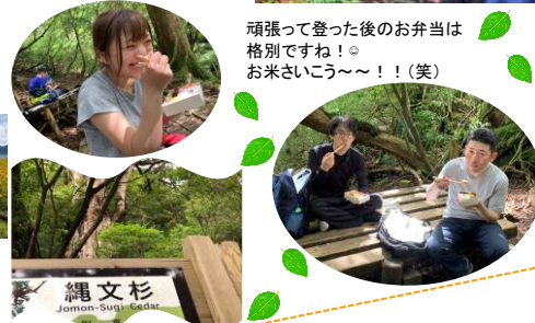
頑張った後のお弁当は格別ですね！◎お米さうごう～～！！(笑)